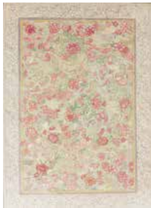
李世铃《梦还花窗》银奖